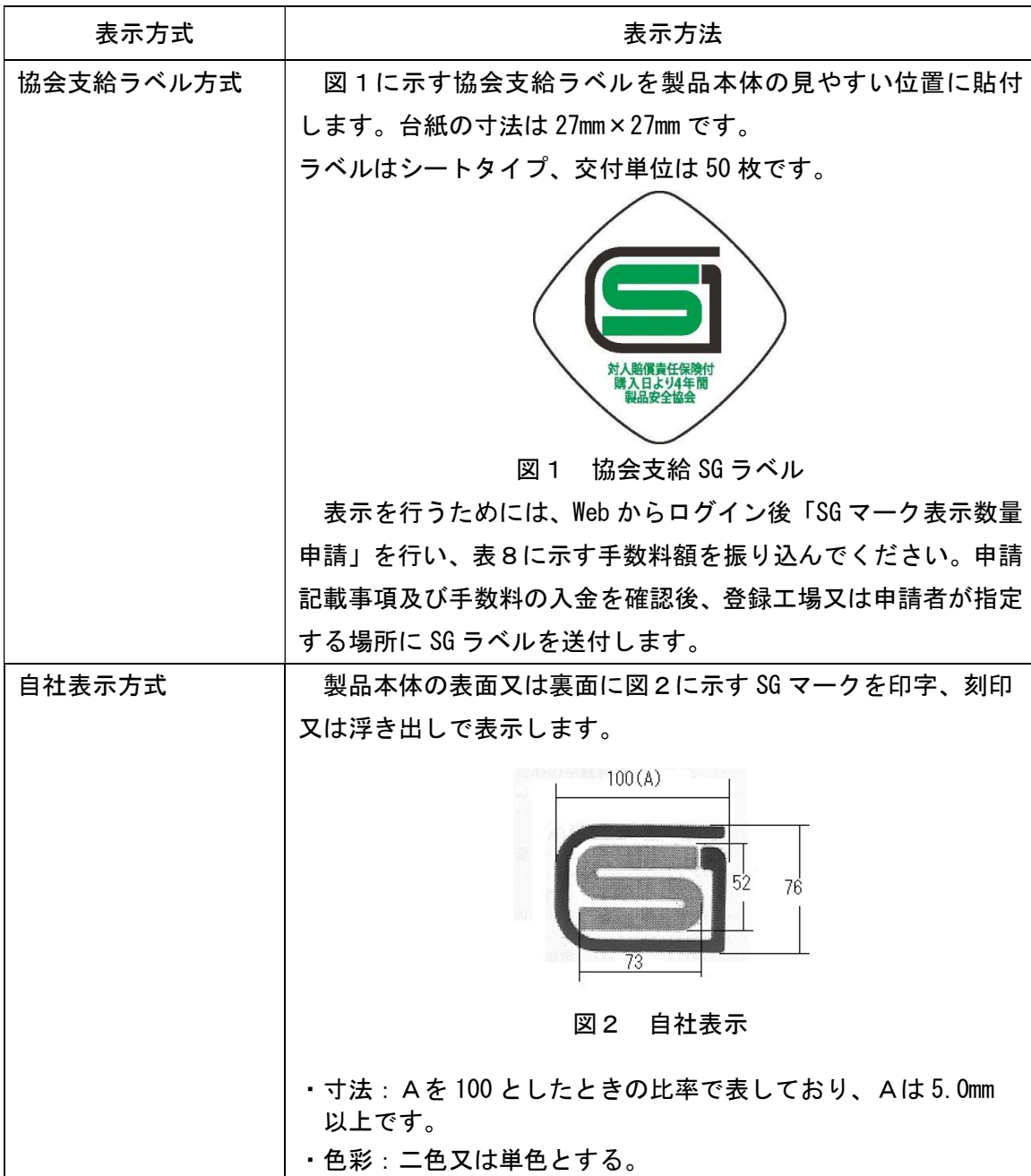
表 7 : 工場登録・型式確認の SG マーク表示方法