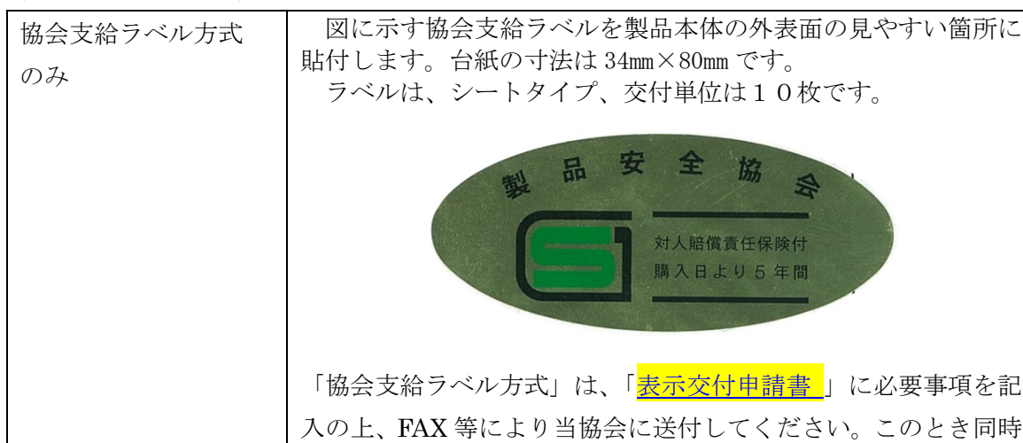
表 8：SG マークの表示方法

SG マークの表示は表 8 に示す方法により行います。複数の方法が記載されている場合には、いずれか 1 つを選択してください。