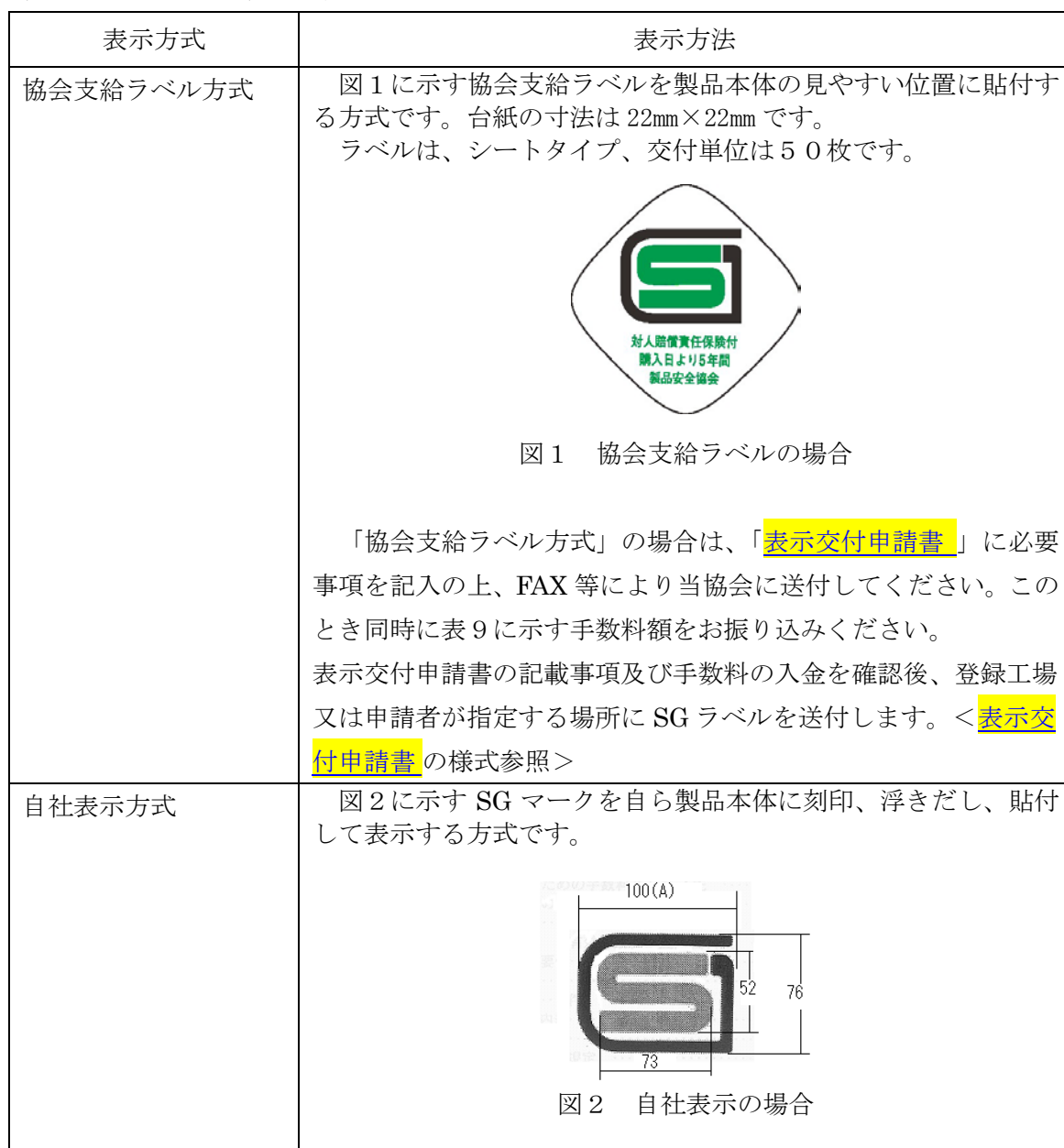
表 8：SG マークの表示方法

SG マークの表示は表 8 に示す方法により行います。複数の方法が記載されている場合には、いずれか 1 つを選択してください。