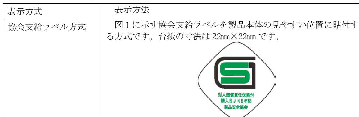
表14：SGマークの表示方法

SGマークの表示は表14に示す方法により行います。複数の方法が記載されている場合には、いずれか1つを選択してください。