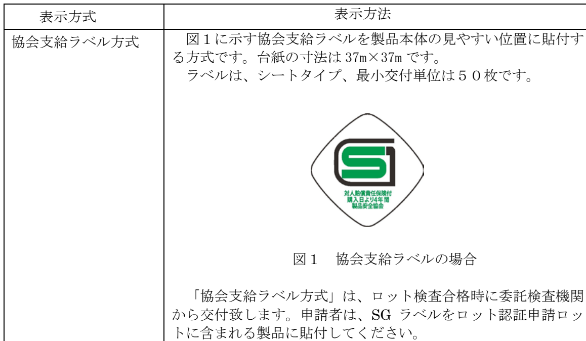
表 1 4 : SG マークの表示方法

SG マークの表示は表 1 4 に示す方法により行います。複数の方法が記載されている場合には、いずれか 1 つを選択してください。