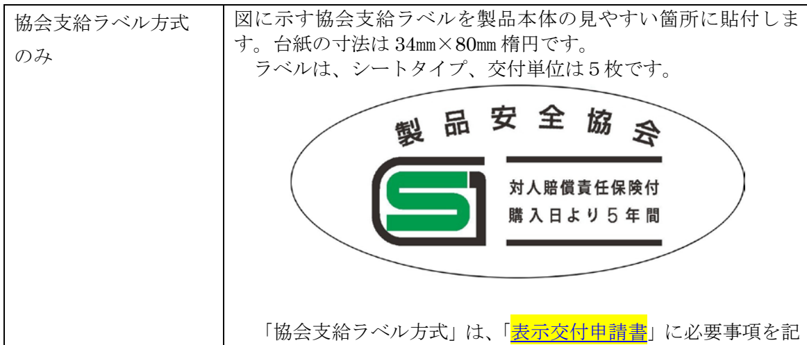
表 8：SG マークの表示方法

SG マークの表示は表 8 に示す方法により行います。複数の方法が記載されている場合には、いずれか 1 つを選択してください。