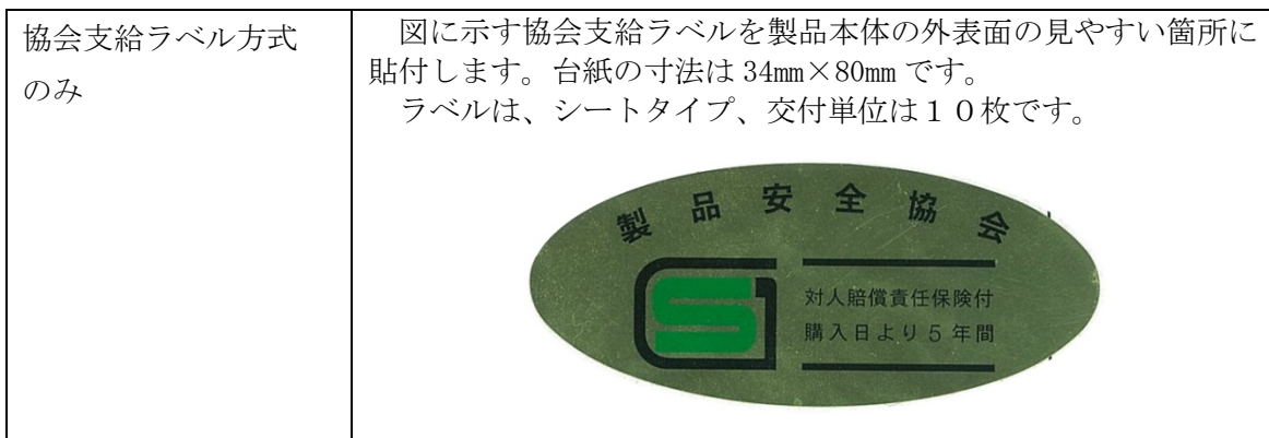
表 8：SG マークの表示方法

SG マークの表示は表 8 に示す方法により行います。複数の方法が記載されている場合には、いずれか 1 つを選択してください。