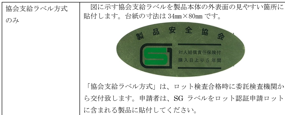
表 1 4 : SG マークの表示方法

SG マークの表示は表 1 4 に示す方法により行います。複数の方法が記載されている場合には、いずれか1つを選択してください。