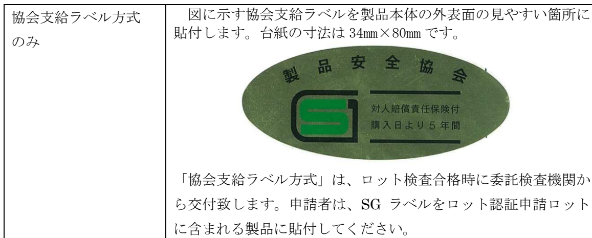
表 1 4 : SG マークの表示方法

SG マークの表示は表 1 4 に示す方法により行います。複数の方法が記載されている場合には、いずれか1つを選択してください。