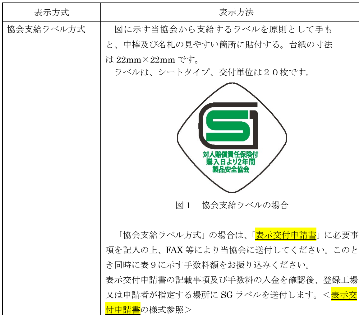
表 8 : SG マークの表示方法

申請は代理人が行うことも可能です。代理人による申請を希望される場合には、申請者が当該代理人に表示交付申請を委任する旨の委任状が必要です。作成の上、申請書に添えて提出してください。<委任状の様式参照>