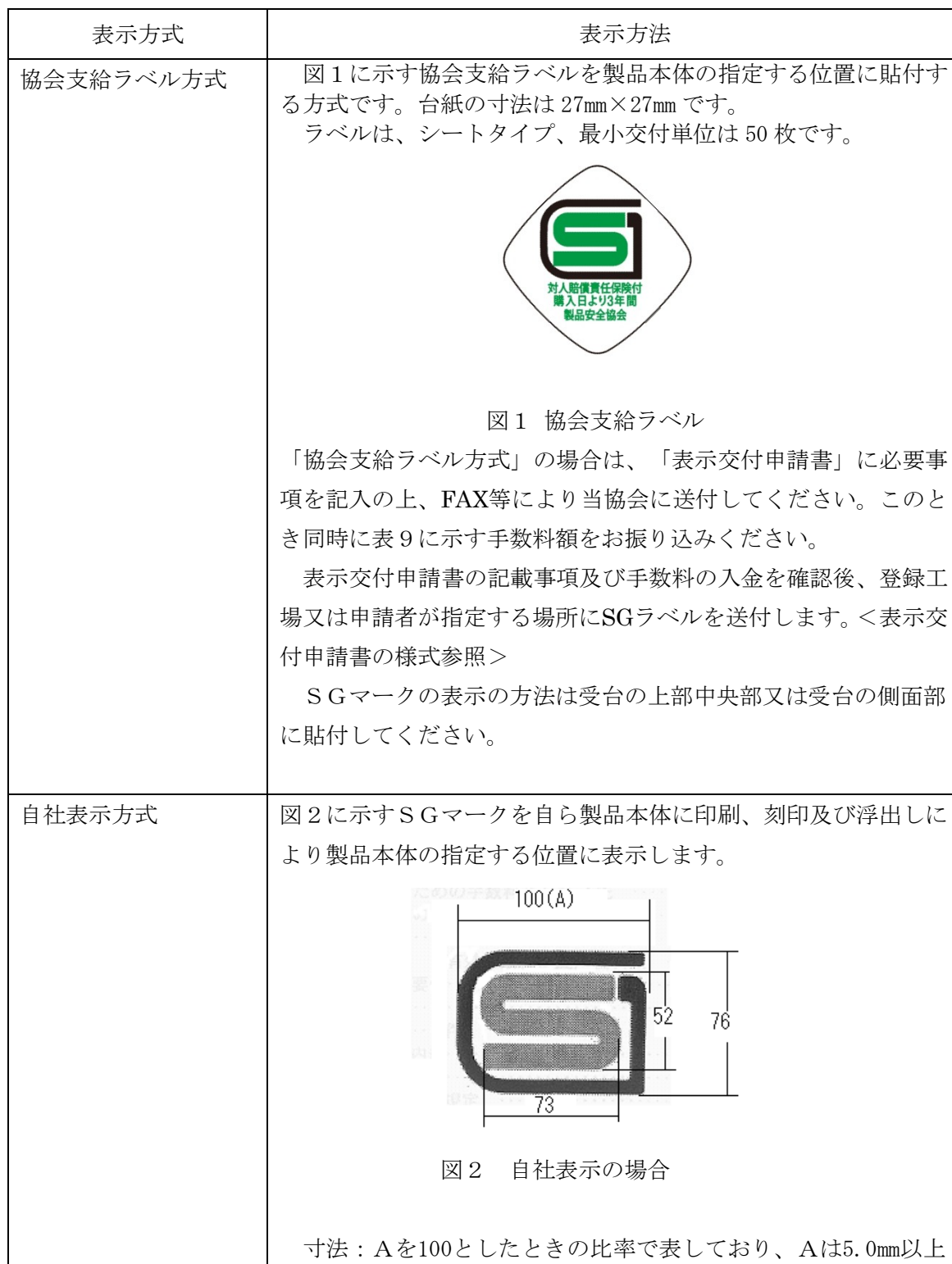
表 7：SG マークの表示方法