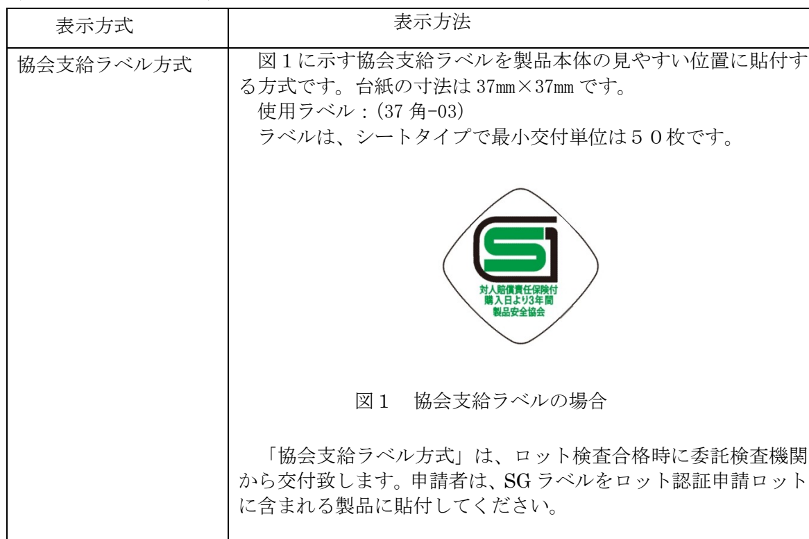
表 1 4 : SG マークの表示方法

SG マークの表示は表 1 4 に示す方法により行います。複数の方法が記載されている場合には、いずれか1つを選択してください。