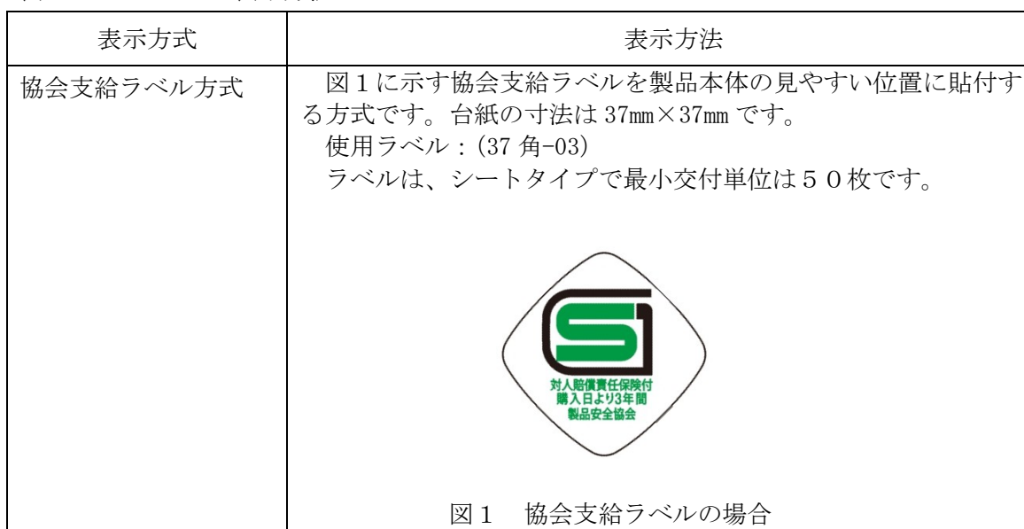
表 8：SG マークの表示方法

SG マークの表示は表 8 に示す方法により行います。複数の方法が記載されている場合には、いずれか 1 つを選択してください。