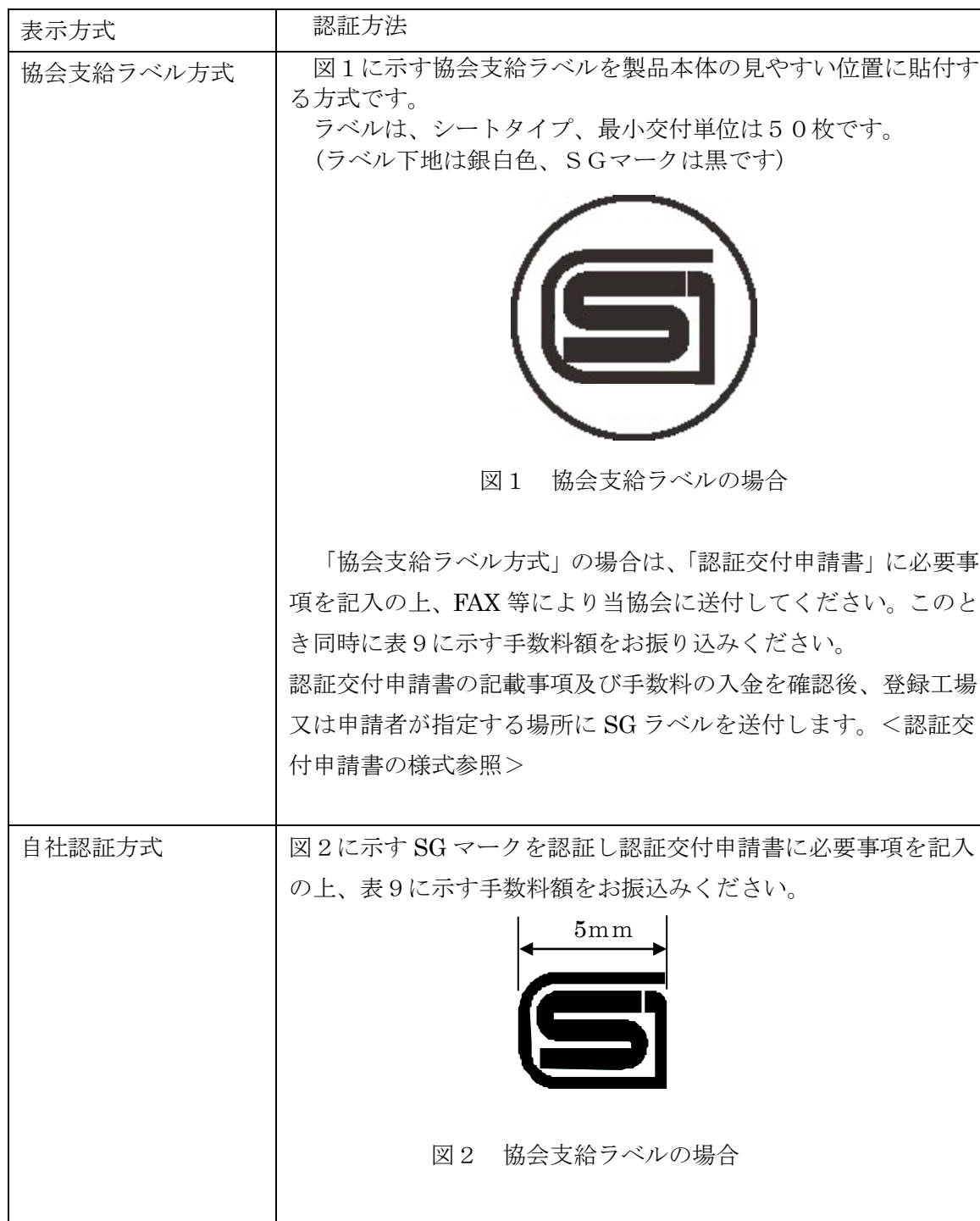
表 1 4 : SG マークの認証方法