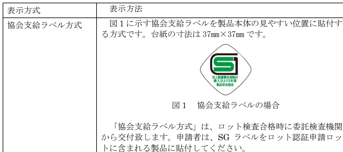
表 1 4 : SG マークの表示方法

SG マークの表示は表 1 4 に示す方法により行います。複数の方法が記載されている場合には、いずれか1つを選択してください。