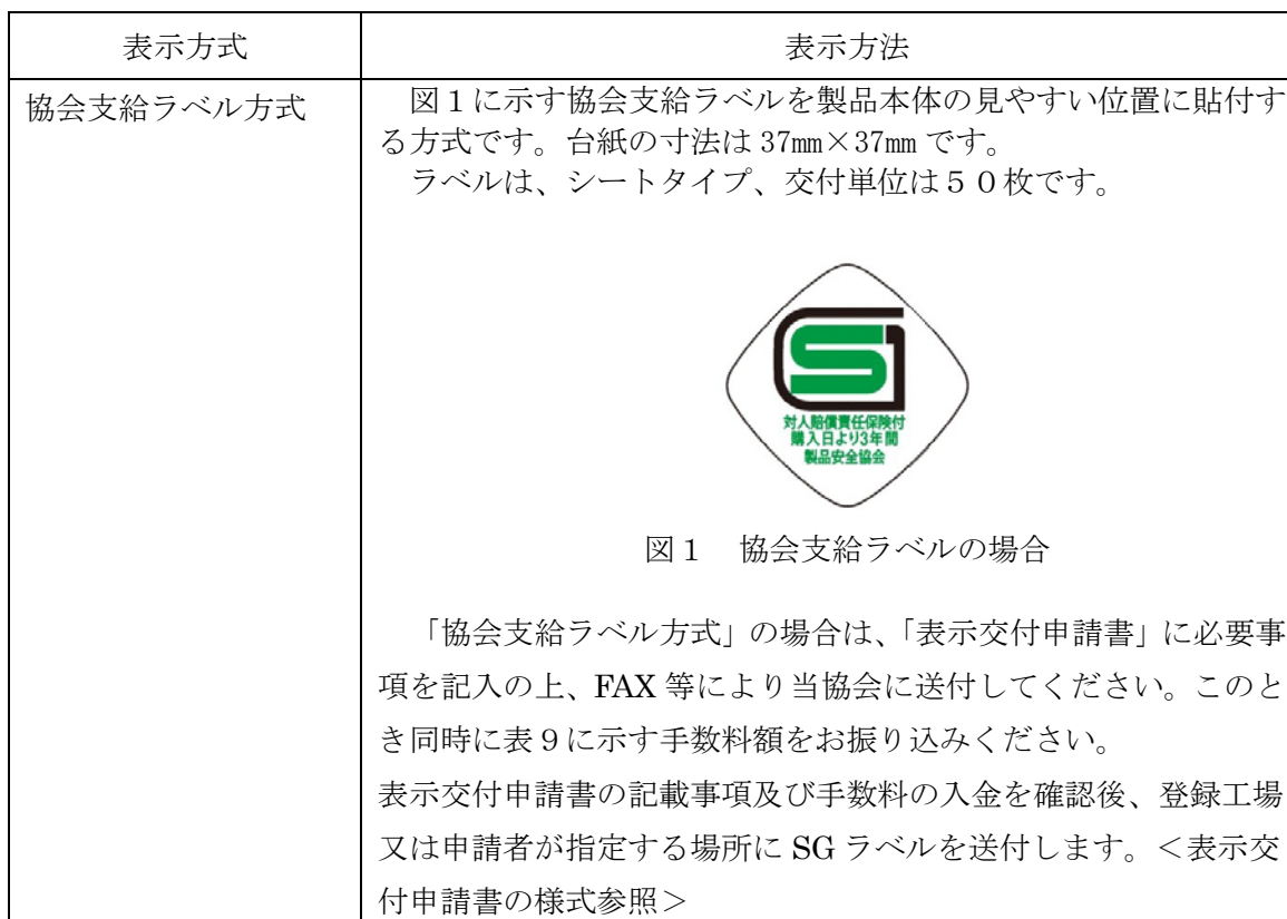
表8：SGマークの表示方法

申請は代理人が行うことも可能です。代理人による申請を希望される場合には、申請者が当該代理人に表示交付申請を委任する旨の委任状が必要です。作成の上、申請書に添えて提出してください。＜委任状の様式参照＞